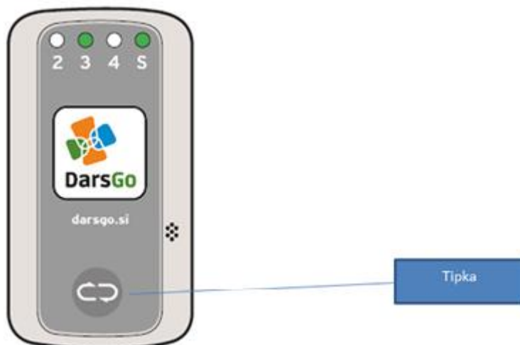
Immagine 2: Dispositivo DarsGo

Per l'uso del sistema DarsGo è obbligatorio l'uso di un dispositivo DarsGo. Il dispositivo DarsGo è di proprietà della società DARS, d. d. ed è dato in uso al cliente. Il dispositivo DarsGo è presentato nell'immagine 2.