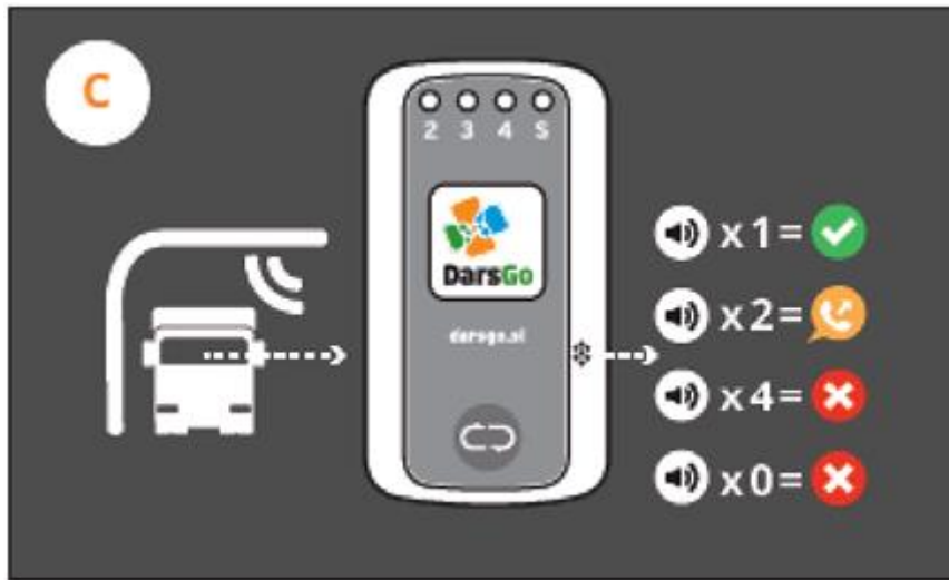
Immagine 3: Segnali del dispositivo DarsGo durante i passaggi del veicolo attraverso i punti di pedaggio

A ogni passaggio attraverso un punto di pedaggio, il dispositivo DarsGo notificherà l'azione al conducente con un segnale acustico, come indicato nell'immagine 3.