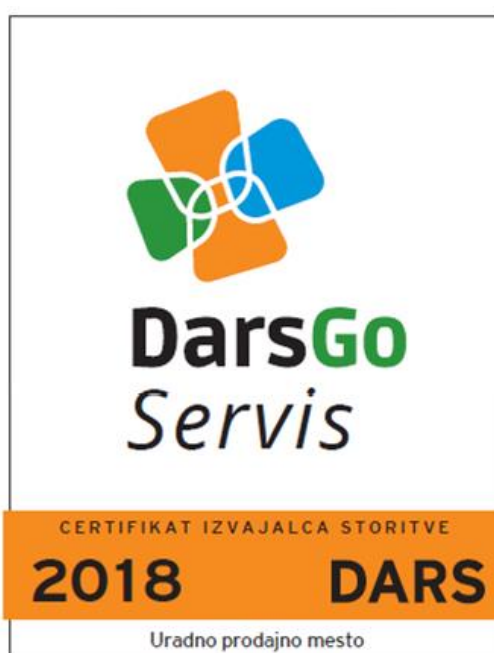
Immagine 1: Certificato del DarsGo servis

Le posizioni dei DarsGo servis sono pubblicate sul portale web www.darsgo.si . I DarsGo servis sono contrassegnati in tutte le località da un marchio comune, indicato nell'immagine 1.